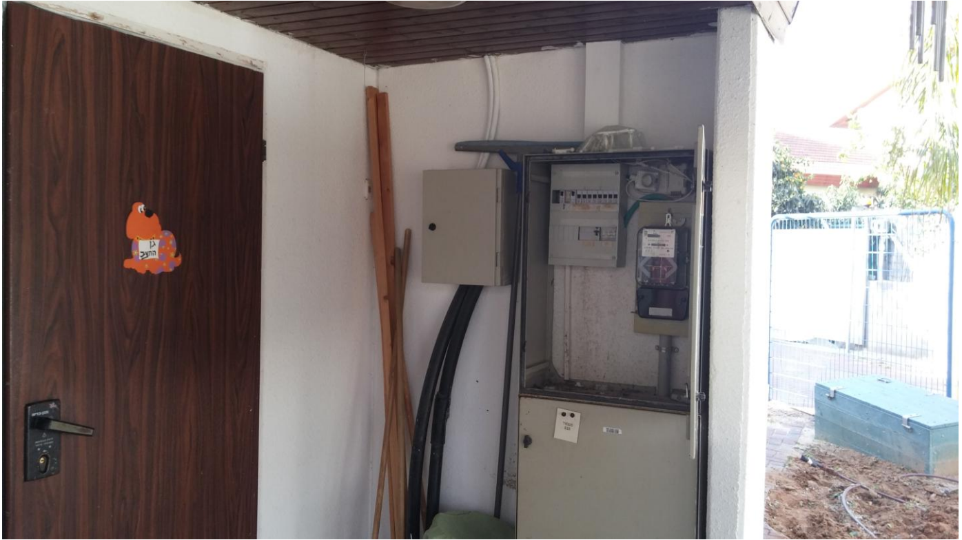
בשירותים, סמוך לקיר הגובל עם לוח החשמל בגן חצב