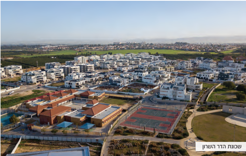
שכונת הדר השרון