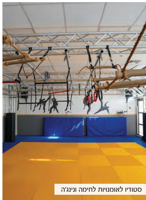
סטודיו לאומנויות לחימה ונינג'ה