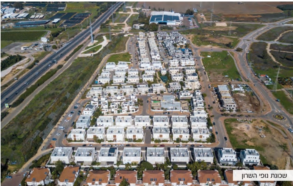
שכונת נופי השרון

שכונות הדר השרון ונופי השרון בשכונת הדר השרון מתגוררות כבר עתה כ-450 משפחות חדשות, מתוכן כ-120 משפחות עברו לפרדסיה בשנה האחרונה. בשכונת נופי השרון מתגוררות כיום כ-220 משפחות, מתוכן כ-30 משפחות עברו לפרדסיה בשנה האחרונה.