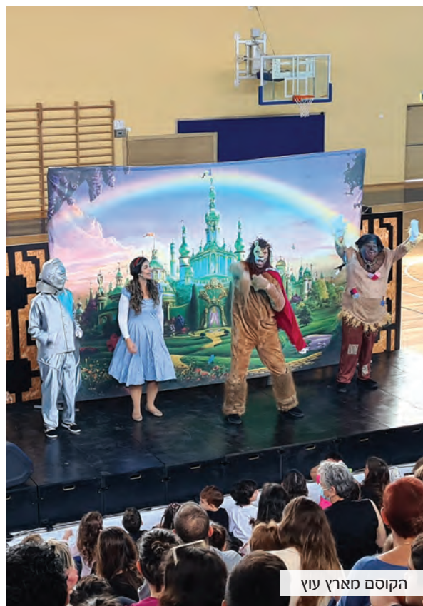
הקוסם מארץ עוץ