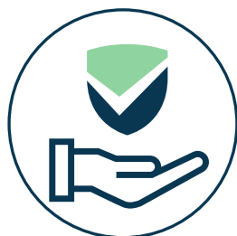
ביטחון ובטיחות עמוד 5