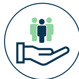
מענה ושירות לתושב עמוד 4