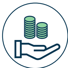
גבייה עמוד 8