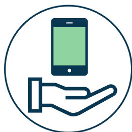
פרטי התקשרות עמוד 10