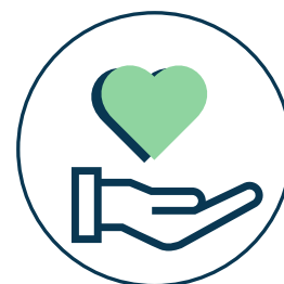
המרכז הקהילתי עמוד 7