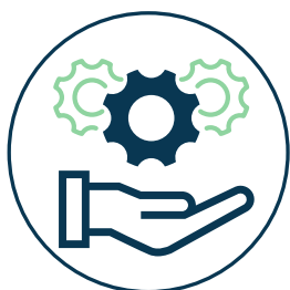
אגף תפעול עמוד 9