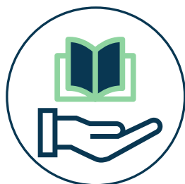
אגף החינוך והנוער עמוד 6